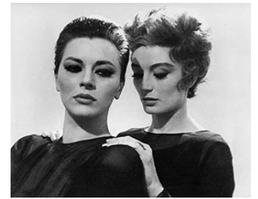
1964 LA FUGUE (La Fuga) de Paolo Spinola avec Giovanna Ralli