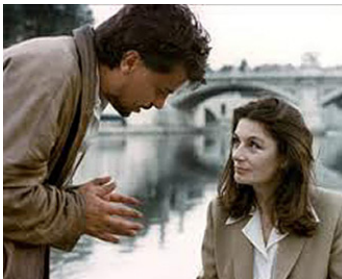
1979 LE SAUT DANS LE VIDE (Salto nel vuoto) de Marco Bellocchio avec Michele Placido