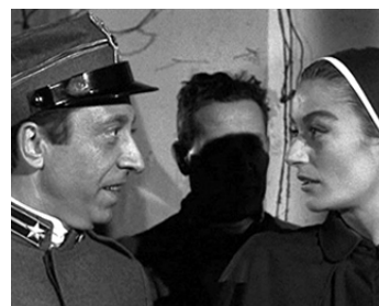
1962 LE JOUR LE PLUS COURT (Il Giorno più corto) de Sergio Corbucci avec Aroldo Tieri