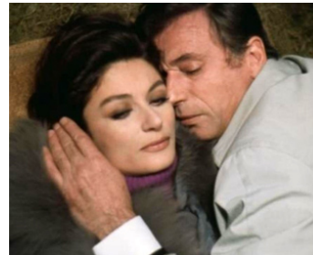
1967 UN SOIR, UN TRAIN (De Trein der Taagheid) d'André Delvaux avec Yves Montand