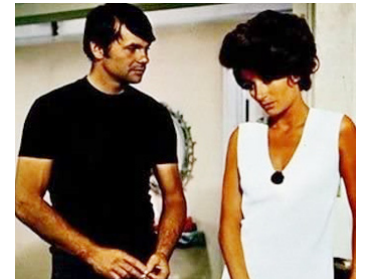
1968 MODEL SHOP de Jacques Demy avec Gary Lockwood