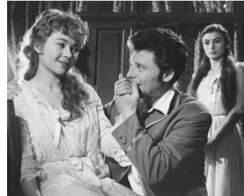
1957 POT-BOUILLE de Julien Duvivier avec Danny Carrel, Gérard Philipe