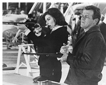
1962 LES GRANDS CHEMINS de Christian Marquand avec Renato Salvatori