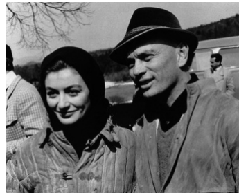
1958 LE VOYAGE (The Journey) d'Anatole Litvak avec Yul Brynner