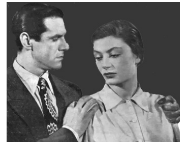
1950 NUIT D'ORAGE (Noche de Tormenta) de Jaime de Mayora avec Mario Cabré