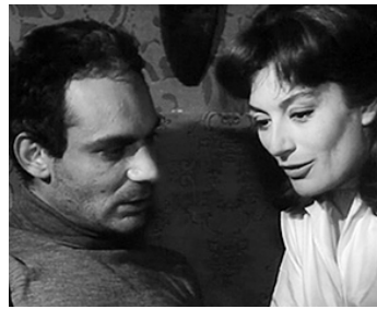
1963 LE TERRORISTE (Il Terrorista) de Gianfranco De Bosio avec Gian Maria Volonté