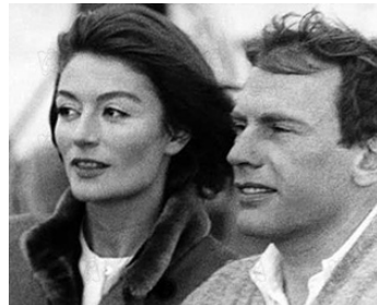
1966 UN HOMME ET UNE FEMME de Claude Lelouch avec Jean-Louis Trintignant