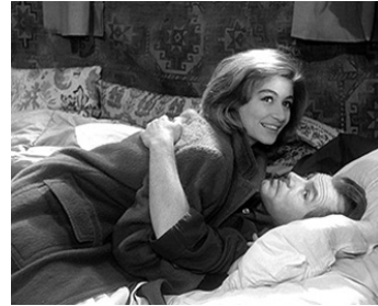
1953 L'AMOUR NE MEURT JAMAIS (Ich suche dich) d'O. W. Fischer avec O. W. Fischer