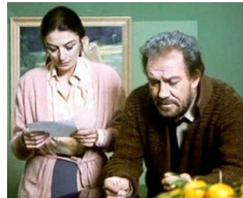
1981 LA TRAGÉDIE D'UN HOMME RIDICULE de Bernardo Bertolucci avec Ugo Tognazzi