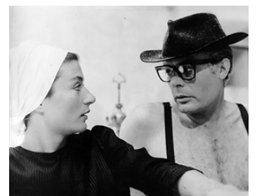
1963 HUIT ET DEMI (Otto e mezzo) de Federico Fellini avec Marcello Mastroianni