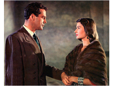
1954 MEURTRE, DROGUE & COMPAGNIE (Contraband Spain) de L. Huntington avec Richard Greene