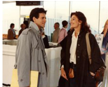
1981 QU'EST-CE QUI FAIT COURIR DAVID ? d'Élie Chouraqui avec Francis Huster