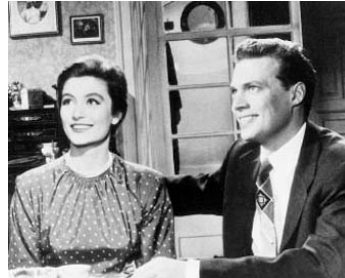
1956 NINA (Romeo und Juliet in Wien) de Rudolf Jugert avec Karlheinz Böhm