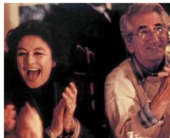
1993 LES MARMOTTES d'Élie Chouraqui avec Daniel Gélin