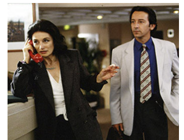
1994 DIS-MOI OUI... d'Alexandre Arcady avec Jean-Hughes Anglade