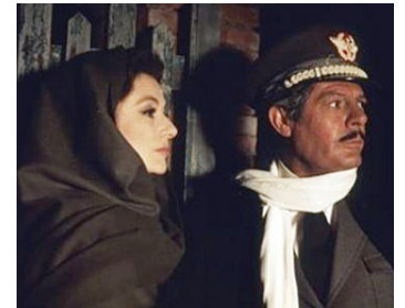
1982 LE GÉNÉRAL DE L'ARMÉE MORTE de Luciano Tovoli avec Marcello Mastroianni