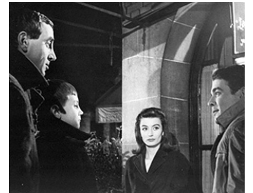
1959 LES DRAGUEURS de Jean-Pierre Mocky avec Charles Aznavour, Jacques Charrier