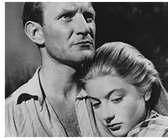
1949 LA SALAMANDRE D'OR (Golden Salamander) de Ronald Neame avec Trevor Howard