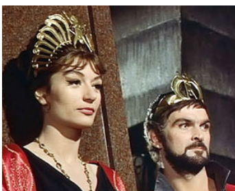
1961 SODOME ET GOMORRHE (Sodoma e Gomorra) de R. Aldrich & S. Leone avec Stanley Baker