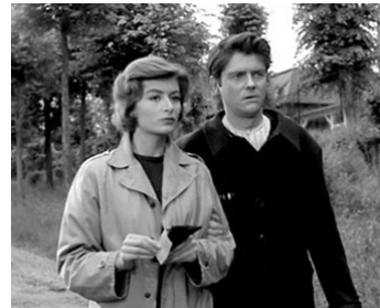
1958 LA TÊTE CONTRE LES MURS de Georges Franju avec Jean-Pierre Mocky