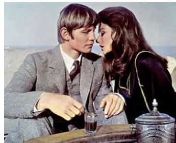
1969 JUSTINE (Justine) de George Cukor avec Michael York