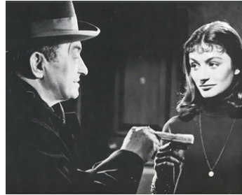
1952 L'HOMME QUI REGARDAIT PASSER LES TRAINS d'Harold French avec Claude Rains