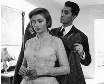
1955 LES MAUVAISES RENCONTRES d'Alexandre Astruc avec Jean-Claude Pascal