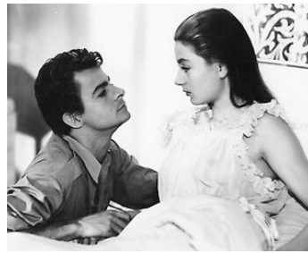
1948 LES AMANTS DE VÉRONE d'André Cayatte avec Serge Reggiani