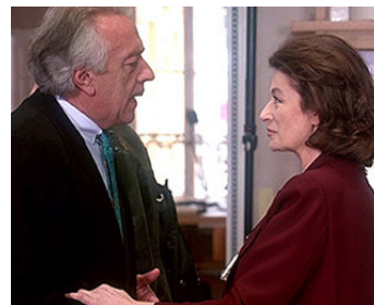
1993 PRÊT-À-PORTER (Ready to wear) de Robert Altman avec Jean-Pierre Cassel