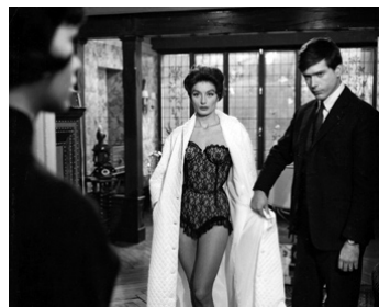
1959 L'IMPRÉVU (L'Imprevisto) d'Alberto Lattuada avec Tomas Milian