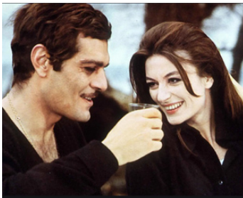
1969 LE RENDEZ-VOUS (The Appointment) de Sidney Lumet avec Omar Sharif