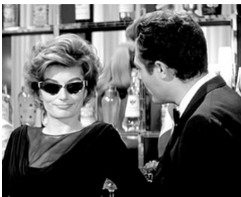
1959 LA DOUCEUR DE VIVRE (La Dolce Vita) de Federico Fellini avec Marcello Mastroianni