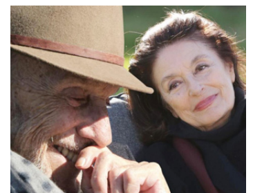
2018 LES PLUS BELLES ANNÉES D'UNE VIE de Claude Lelouch avec J.-L. Trintignant