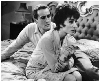
1964 LE SUCCÈS (Il Successo) de Mauro Morassi avec Vittorio Gassman