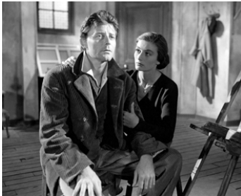
1957 MONTPARNASSE 19 de Jacques Becker avec Gérard Philipe