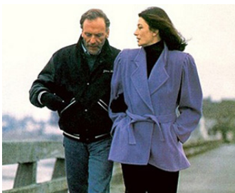
1986 UN HOMME ET UNE FEMME, VINGT ANS DÉJÀ de C. Lelouch avec J.-L. Trintignant