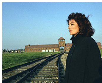
2002 LA PETITE PRAIRIE AUX BOULEAUX de Marceline Loridan