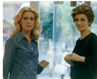
1976 SI C'ÉTAIT À REFAIRE de Claude Lelouch avec Catherine Deneuve