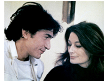
1978 MON PREMIER AMOUR d'Élie Chouraqui avec Richard Berry