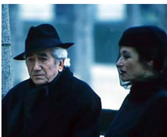
1996 HOMMES, FEMMES, MODE D'EMPLOI de Claude Lelouch avec Daniel Gélin